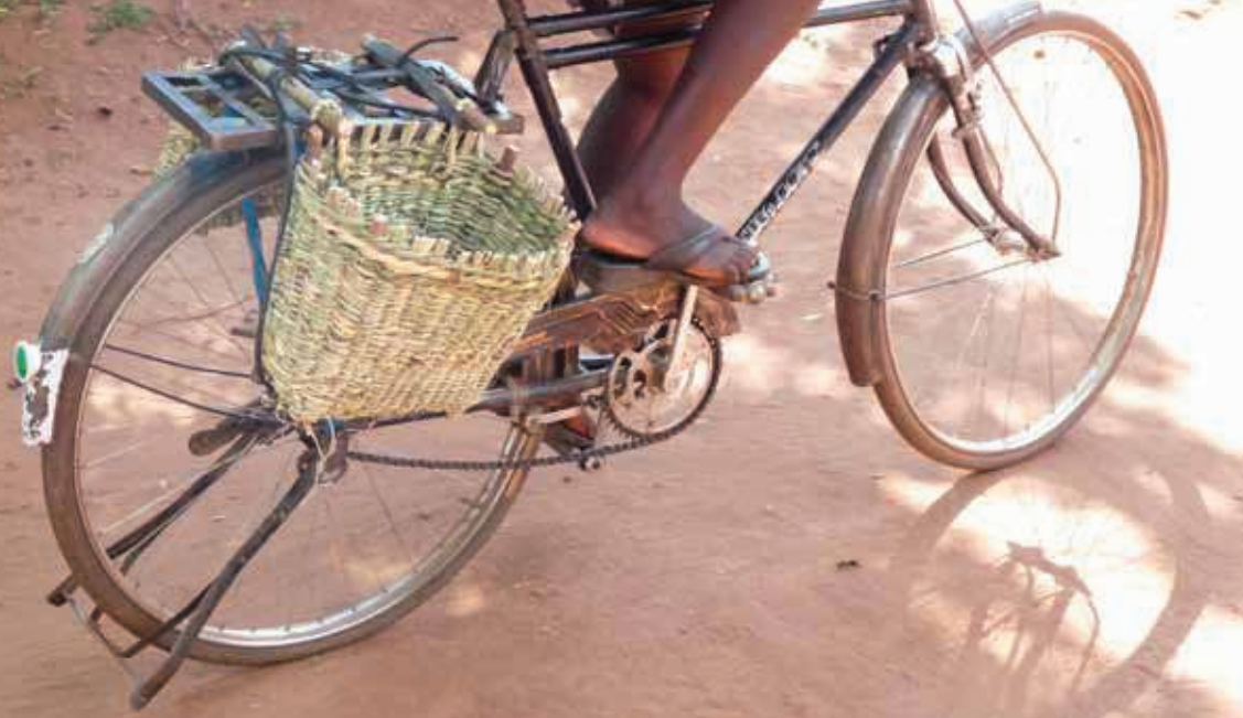
Kurve har en helt praktisk funktion i Uganda – her som cykeltasker.

og handel. Pension og offentlig forsørgelse er kun en godbid til statsansatte gennem mange år. Bønder og andet godtfolk må klare sig selv.